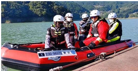
NHK首都圏ネットワークO.A. 2020/10/9

消防・警察向けですが、 一般の方も受講できます。 (ホームページ、もしくはお電話 0274-42-7819 でお問合せください。)