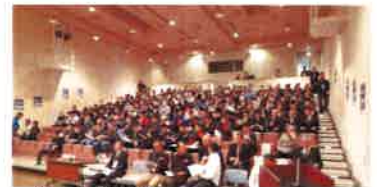
舟艇捜索救助講習 (アウェアネスレベル・座学)

(開催者・申込窓口は当学校です。施設へのお問い合わせ先を別途ご確認ください。) (ショッピングモール以外でも開催しております。)