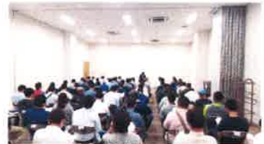
更新講習 (けやきウォーク前橋)